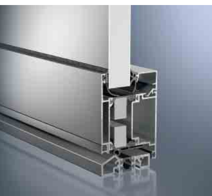
Schüco Tür ADS 70.HI Schüco Door ADS 70.HI

Die hochwärmedämmte Tür eignet sich ideal für die Verbesserung der Energiebilanz eines Gebäudes – bei maximaler Planungsfreiheit.