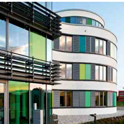
Schüco Aluminium Tür-System ADS 70.HI Schüco Aluminium door system ADS 70.HI

Aluminium Tür-System Aluminium door system